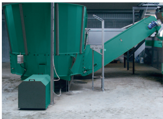
Minimální požadavky na práci: Stačí naplnit stacionární míchárnou (např. MVM Vertikální míchárnou 6,5 – 30 m 3 ).