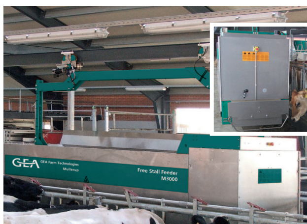
Usilovný dodavatel energie pro zvířata: počítačem řízený, bateriemi poháněný krmný vozík servíruje krmivo každé skupině zvlášť.