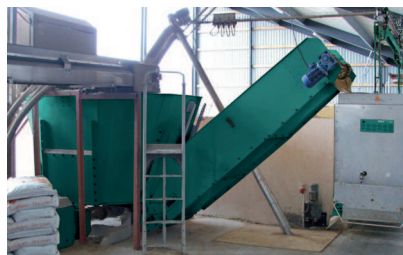
Čerstvá energie: Pro získání vysokohodnotné krmné dávky pracuje míchárna a vozík ruku v ruce.

Díky své stavbě je extrémně flexibilní. Stačí mu jen 2 m široký krmný stůl, což může být výhodou při rekonstrukcích starších stájí, ale i při výstavbě novostaveb, kdy šetří spoustu prostoru, a tím i náklady na stavbu. Zvyšte svou produktivitu na malém prostoru!