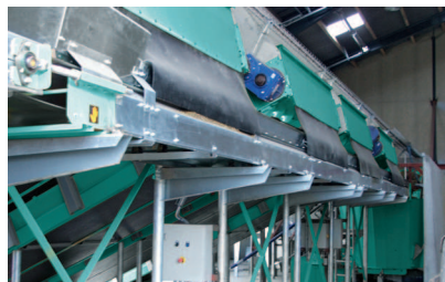
Produktivní krmení – nový stájový společník, kterého zvířata ráda akceptují