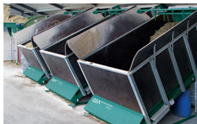
Prostorný: Minimální pracovní nasazení pro plnění zásobníků dle potřeby

Mix & Carry redukuje práci jen na příležitostné naplnění zásobníků a sil. Časté dávkování krmiva v klidu ve stáji zlepšuje u zvířat příjem krmiva a zároveň i jeho zhodnocení. Stále nová dávka udržuje krmivo čerstvé, a bez procesu fermentace. Krmivo bohaté na energii si zvířata vychutnávají až do posledního sousta a čistý krmný stůl bez zbytků krmiva mluví sám za sebe. Vaše zdravě živěné dojnice Vám poděkují tím nejlepším a kvalitním mlékem!