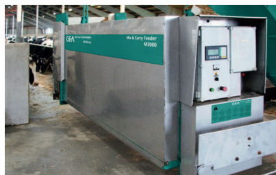
Čistá skutečnost: Volně zavěšený dávkovací vozík nad krmným stolem

S individuální recepturou krmné směsi naservírujete každé skupině zvířat krmný plán podle Vašich představ. Rychlý přístup ke krmným plánům, komponentám, dávkovanému krmivu poskytuje obsluze nenáročné řízení WIC. Již jednou nastartovaný se krmný vozík Mix & Carry zcela samostatně postará o navážení, smíchání a dávkování krmiva zvířatům. Samozřejmě systém není úplně bez obsluhy, ale i přesto Vám poskytuje úsporu času a práce, čímž Vám umožňuje věnovat čas intenzivnímu managementu stáda, kde můžete přesně sledovat vliv tohoto konceptu a optimalizovat ho pro dlouhodobý úspěch.